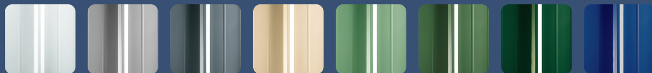
RAL 9010 Bianco RAL 9006 Grigio silver RAL 7015 Ardesia-grigio RAL 1015 Bianco avorio RAL 6021 Verde rame RAL 6011 Verde reseda RAL 6005 Verde muschio RAL 5010 Blu genziana

N.B.: Tutti i colori riportati non riproducono fedelmente il corrispondente codice RAL.